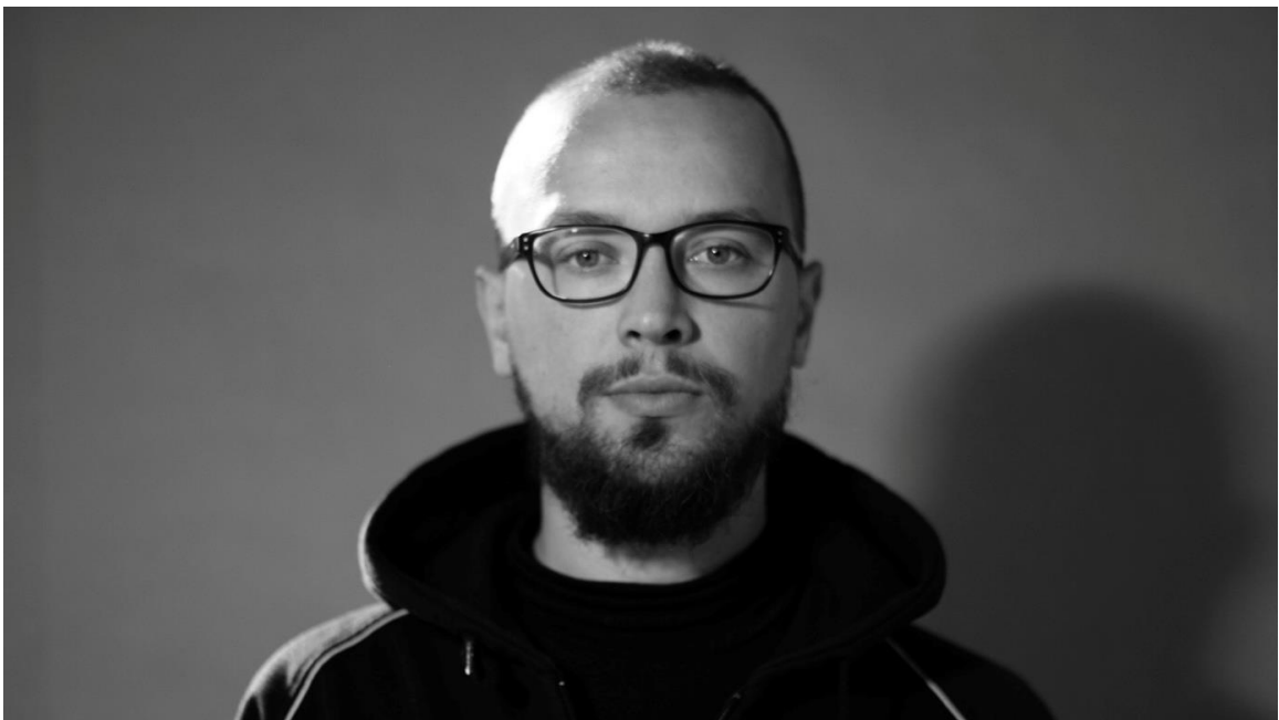
Ci-dessus : Mon grand-père et moi