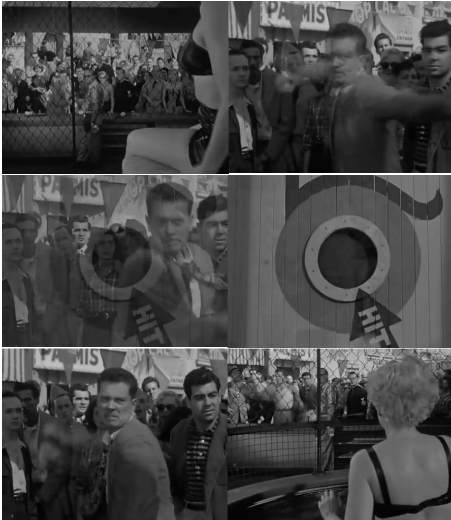
« The sniper » (1952) d'Edward Dmytryk.

Cette représentation frontale, directe, des peurs masculines, culmine dans la séquence foraine du film où toute une société exhibe la femme comme un monstre de foire érotisé et encourage le protagoniste à participer à un jeu d'adresse consistant à viser une cible pour faire chuter dans un bassin l'obscur objet du désir... La folie individuelle qui va