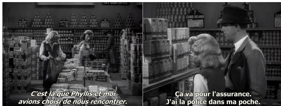
« Double indemnity » (1944) de Billy Wilder.

Browning invente là l'une des plus tragique figure de femme fatale de l'histoire du cinéma. Les meilleurs films mettant en scène ce type de personnages dépasseront ainsi toujours la simple mise en image d'une peur toute masculine de la femme devenue trop forte, pour atteindre à la dimension complexe du portrait.