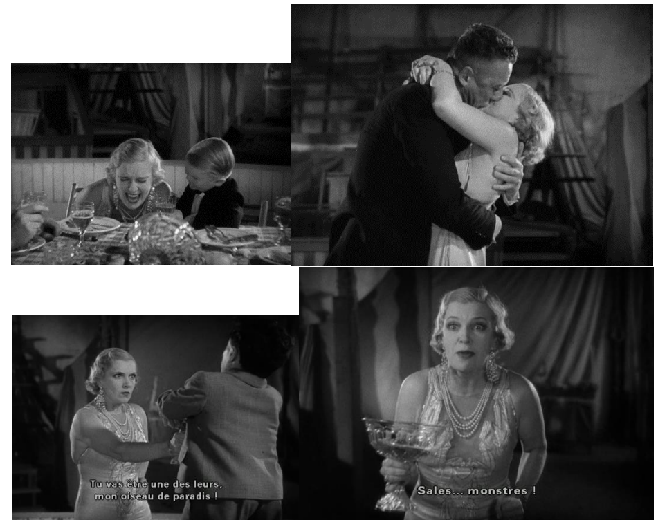
« Freaks » (1932) de Tod Browning.

C'est de ce genre de femme, moderne et indépendante, assumant sa séduction comme les hommes assument le pouvoir, que va naître, dès l'application systématique du code de censure, la femme fatale calculatrice, dominante, monstrueuse.