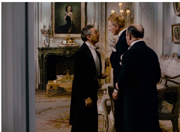
« On the riviera » (1951) de Walter Lang.

Il est intéressant de constater que le tableau, peint pour le film, l'est en fait sur un agrandissement photographique de Gene Tierney, sorte de rotoscopie avant l'heure visant à produire un troublant effet de réalité. Cet élément de décor fameux sera réutilisé à plusieurs reprises dans d'autres œuvres produites par la Fox.