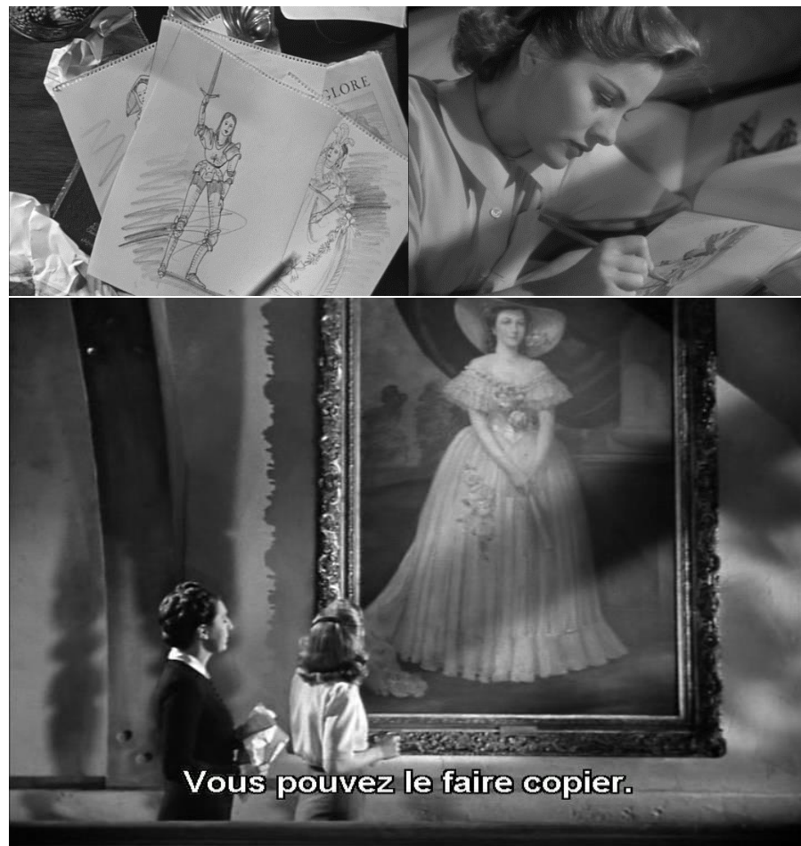
« Rebecca » (1940) d'Alfred Hitchcock.

La tradition du portrait peint au cinéma commence ouvertement avec le premier film américain d'Alfred Hitchcock. En émigrant aux Etats-Unis, le cinéaste britannique apporte avec lui ce motif récurrent du gothique littéraire anglais.