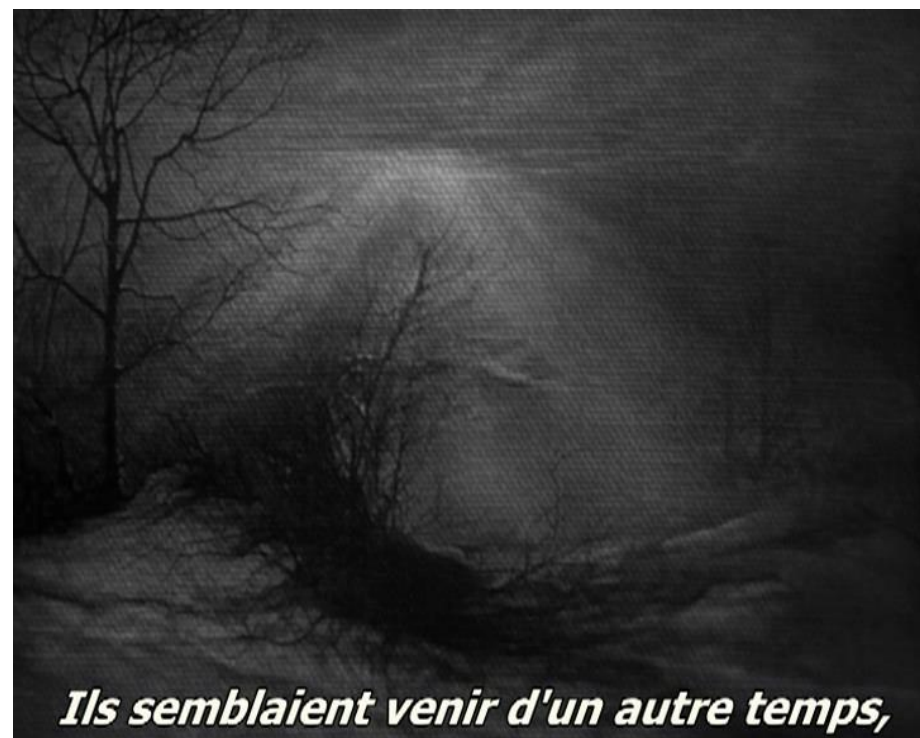
« Portrait of Jennie » (1948) de William Dieterle.

Identifiant la toile de l'écran à celle du peintre, « Le portrait de Jennie » entremêle les questionnements de l'inspiration de l'artiste et de la compréhension de l'être. Muse onirique au passé trouble, le personnage de Jennie apparaît au peintre incarné par Joseph Cotten à différents âges. Le mystère entourant la jeune femme est à l'origine du talent de l'artiste.