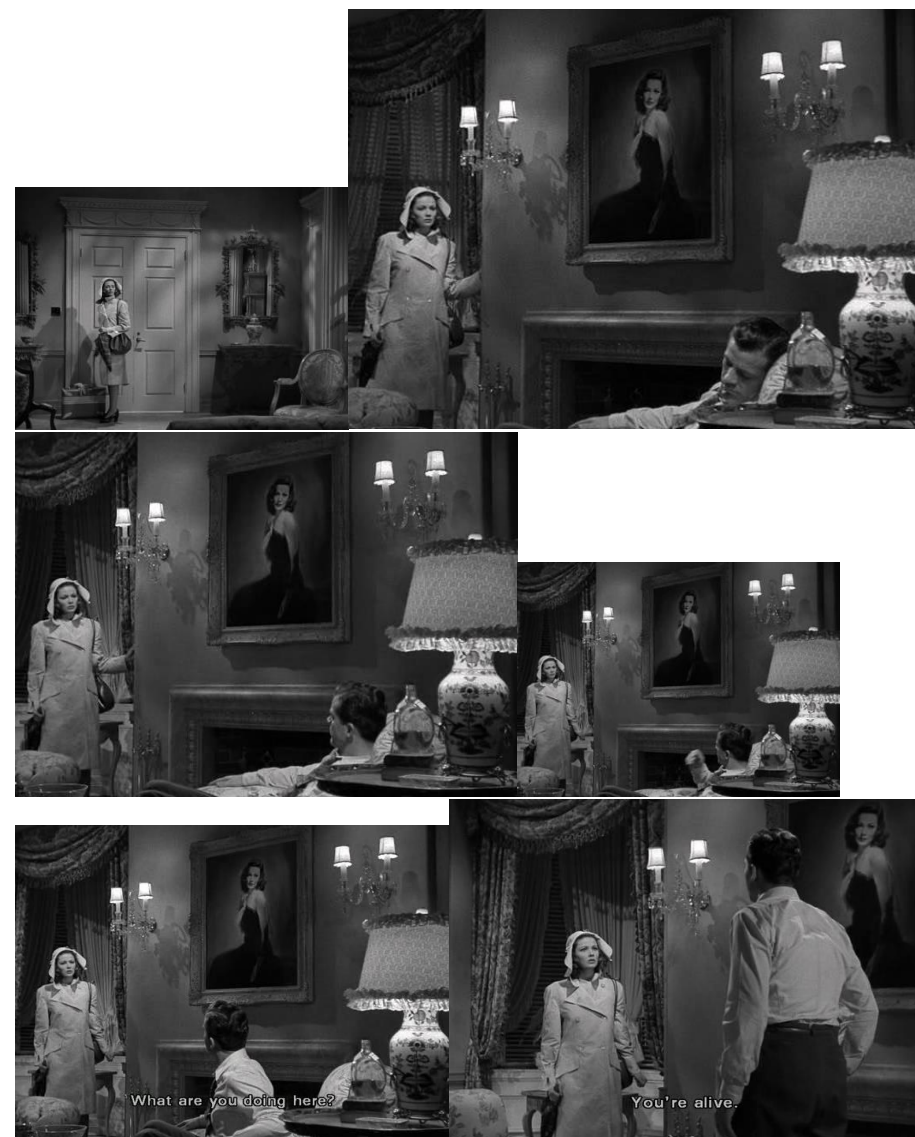
« Laura » (1944) d'Otto Preminger.

En effet, le film élude tous les clichés inhérents au genre : Laura ne doit sa réussite qu'à son intelligence, elle n'a rien du monstre calculateur que représente en général la femme