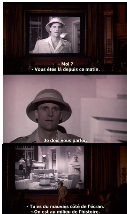
« The Purple Rose of Cairo » (1984) de Woody Allen.