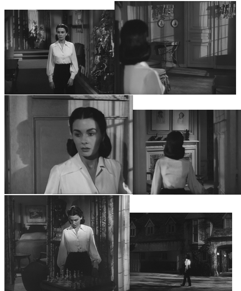
« Angel face » (1952) d'Otto Preminger.

Le film de John Stahl forme avec « Laura » un curieux dytique autour de la figure de Gene Tierney, femme moins fatale que marquée par la fatalité.