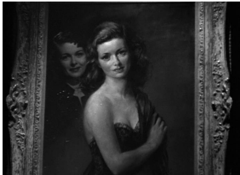
« Woman in the window » (1944) de Fritz Lang.

fantasme comme élément charnière du récit forcément criminel qui entraîne un procureur marié à dissimuler un meurtre commis pour une femme aussi belle que mystérieuse.