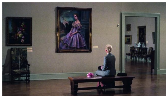
« Vertigo » (1958) d'Alfred Hitchcock.

Jennie détient, incarne, ce qui permet au créateur que met en scène le film de témoigner d'une vision du monde. Figure ouvertement fantastique, fantomatique et pourtant incarnée, le personnage féminin de ce film-enquête sur un amour impossible ne relève ni de la femme fatale ni de la femme victime. Elle est présumablement ce miroir dans lequel l'homme fasciné se regarde lui-même et tente de se comprendre.