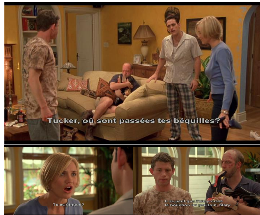
« There is something about Mary » (1998) de Bobby et Peter Farrelly.

connu, qui est observé par la mise en scène de Preminger, cinéaste du réel et de la vérité des êtres.