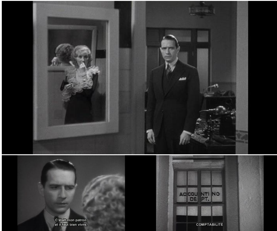
« Baby face » (1933) d'Alfred E. Green.

une « super image » qui mélange, pour celui dans le regard duquel elle consiste, la beauté érotique et l'horreur abjecte.