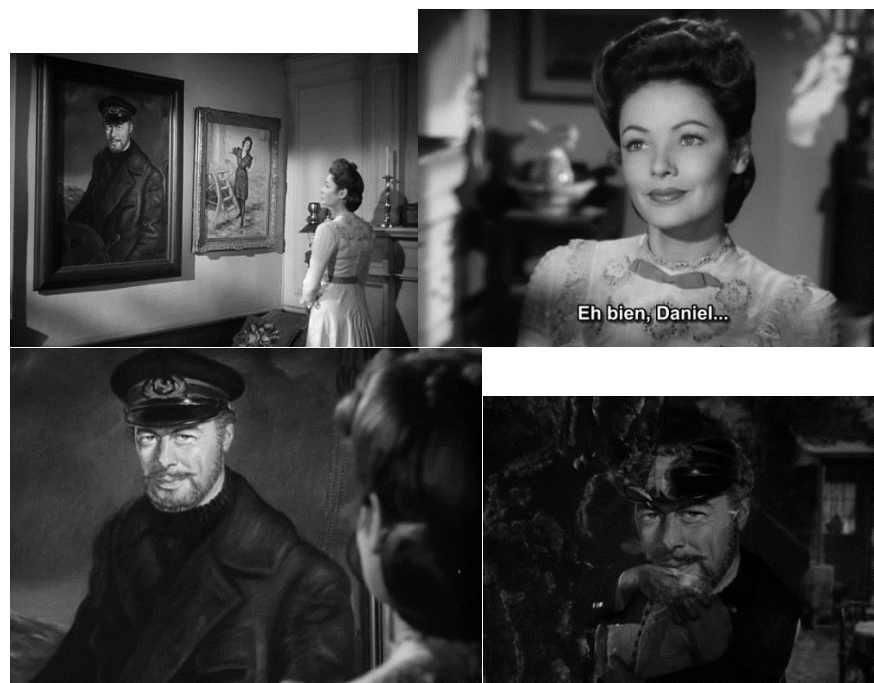
« The ghost and Mrs Muir » (1948) de Joseph L. Mankiewicz.

Plus encore que la fascination qu'il suscite, le portrait au cinéma prend littéralement possession de ceux qui le regarde. L'exemple canonique reste le portrait de Carlotta exerçant un magnétisme morbide sur sa petite-fille, Madeleine (prénom à la consonance proustienne évidente), dans le « Sueurs froides » d'Hitchcock, qui développe avec ce film inclassable la réflexion entamée avec « Rebecca » sur le rapport vampirique entre regardeur et regardé.