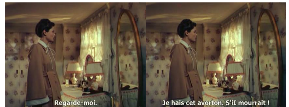
« Leave her to heaven » (1945) de John Stahl.