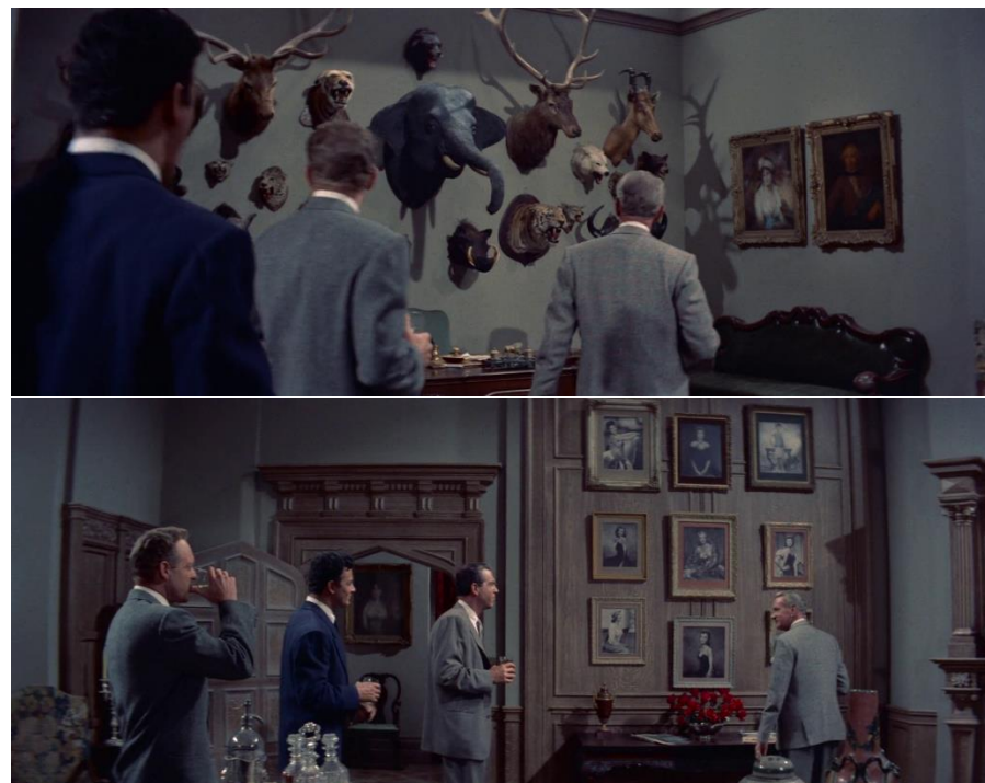
« Woman's world » (1954) de Jean Negulesco.

semble poser un regard moral sur les actes de l'usurpateur. Les films qui utiliseront cette image iconique de la star de la Fox viennent ainsi renforcer le caractère d'absolue honnêteté que le film de Preminger associait déjà au visage de Tierney. Laura devient un fantôme qui hantera, au-delà des cinéphiles, certains films eux-mêmes.