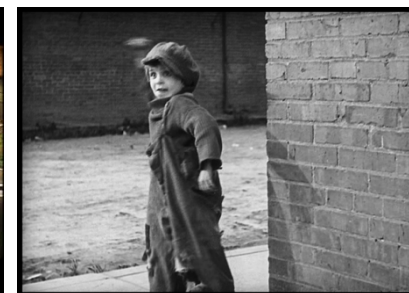
The kid (1921) Chaplin.

Le burlesque est un genre subversif qui n'aime rien tant que la destruction des valeurs sociales établies. La casse y est fréquente et jouissive !