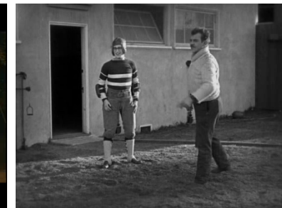
The freshman (1925) Newmeyer.

Le burlesque est synonyme d'exploit physique ! Il met donc en scène des sportifs de haut niveau capable d'accomplir de vrais exploits devant la caméra !