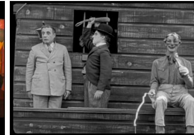
The circus (1928) Chaplin.

Le corps burlesque est un corps de poupée qui base souvent sa gestuelle sur la répétition. Il y a ainsi dédoublement entre l'humain et le pantin.