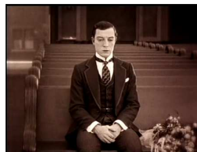
Seven chances (1925) Keaton.

L'acteur burlesque, héritier de la pantomime, sait aussi prendre ses distances avec les mimiques et imposer un décalage dans son jeu comique.