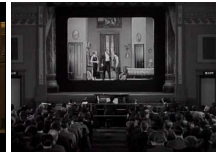
Sherlock Jr (1924) Keaton.

Le burlesque est le genre de la distanciation propice au comique. Il est donc le genre de l'énonciation visible, de la mise en abîme, de l'image dans l'image.