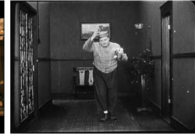
The bellboy (1917) Arbuckle.