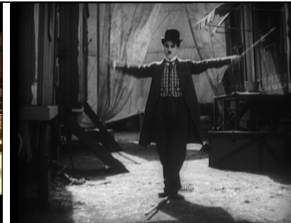
The circus (1928) Chaplin.

Des origines foraines du cinéma le burlesque prend acte, notamment à travers la figure du cirque. C'est là le lieu de la maîtrise virtuose de l'objet.