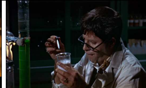
The nutty professor(1963)

L'expérience scientifique n'est, dans le burlesque, que la métaphore d'une expérimentation systématique du monde sensible, matériel (chutes, casses...).