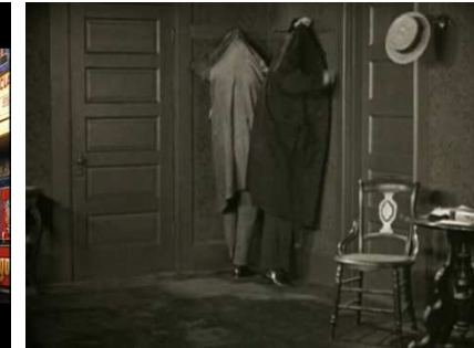
Safety last (1923) Taylor.

Le burlesque identifie souvent un personnage à un objet. L'objet y est d'ailleurs doué d'une vie propre. Il est un authentique partenaire pour le protagoniste.