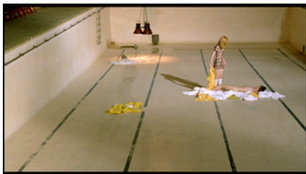
Deep end (1970) shot # 1