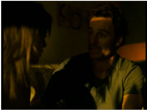
PLAN 1 (1)