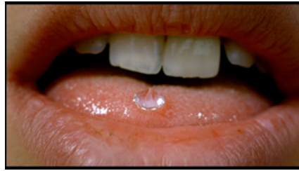
Deep end shot #2

Elle tire les couvertures et le découvre nu, et lui, (cadre en très gros plan) lui montre le diamant sur sa langue, et referme sa bouche. Susan fait semblant de partir, puis revient, se déshabille, se dirige nue vers Mike, qui pose le diamant à côté de lui. Susan fait semblant scrute le diamant, puis revient vers Mike, et commence les préliminaires d'un acte d'amour qui sera avorté par un autre coup de téléphone de son petit ami. Similitudes et différences : tout d'abord, la séquence est clairement vue du point de vue de Mike, même si l'on assiste à une focalisation zéro (caméra placée sous plusieurs angles différents et qui cadre Susan ou/et Mike). Mais l'acte se veut une initiation, la découverte du corps de Susan par Mike. Lors du premier plan moyen sur Mike et Susan, juste quand celle-ci va se coucher, l'éclairage s'est tamisé quelque peu, mais il demeure beaucoup plus lumineux que dans Fish tank , comme pour insister sur le côté « première fois », initiatique, qu'expérimente Mike. Le montage utilise des gros plans sur-découpés et nerveux sur les cheveux de Susan, les yeux de Mike et de Susan, les mains de Mike. Puis la caméra aérienne les cadre en plan moyen, en plongée, dans une pose érotique, tout en faisant une rotation : une réminiscence de certaines peintures de la Renaissance ou des Romantiques.