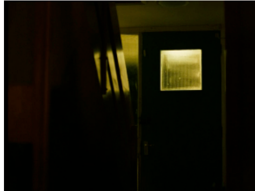
PLAN 2 (2)