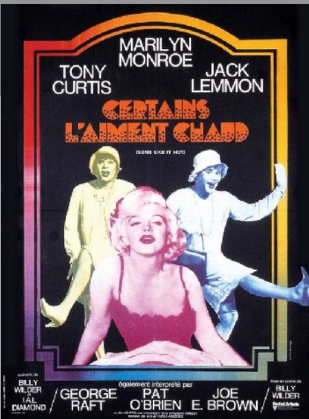
affiche de Jouineau Bourduge