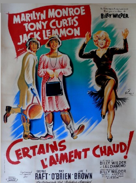
affiche de Boris Grinsson

L'affiche du film proposée par la fiche élève est l'affiche française réalisée par Jouineau Bourduge. On connaît une seconde affiche française pour le film, réalisée par Boris Grinsson, et très différente de celle proposée par la plaquette. Peut-être que ces deux visuels différents correspondent aux deux sorties du film en France, en 1959 et en 1964.