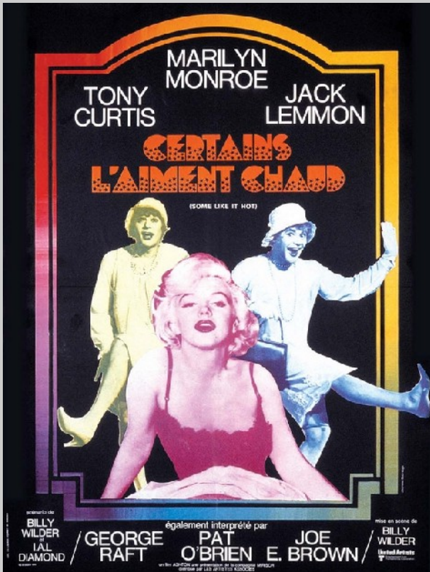
affiche de Jouineau Bourduge